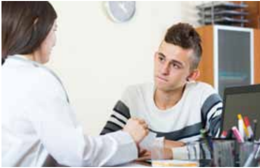
Das Gespräch mit der Schulärztin ist vertraulich.

tin hier eine erste Anlaufstelle, die manch sensibles Gesundheitsthema gegebenenfalls auch mit Eltern und LehrerInnen erörtert. Wenn beispielsweise chronische Krankheiten wie Asthma oder Allergien Einfluss auf die Unterrichtsgestaltung haben, dann wird mit den Eltern und Lehrern kooperiert. Für einen Asthmatiker etwa ist es wichtig, dass er beim Dauerlauf im Sportunterricht offiziell aussetzen kann und soll. Hier ist die Schulärztin ein vermittelnder Partner zwischen Schülern, Eltern und Lehrern.